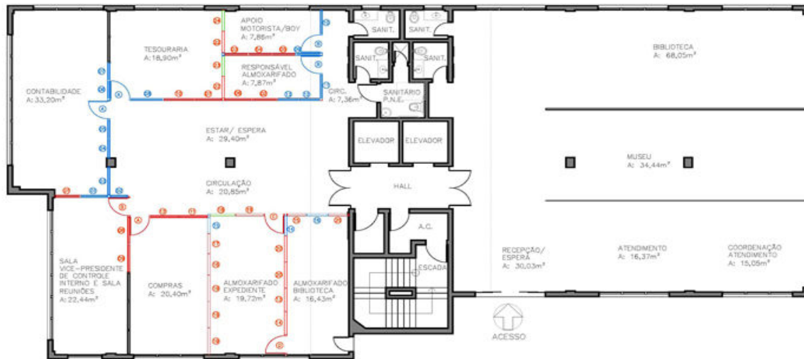
1 PLANTA - LAYOUT PROPOSTO ESCALA 1:100