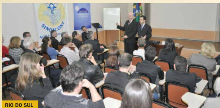
RIO DO SUL

Em todos os locais, na parte da tarde, aconteceu a reunião das Câmaras de Fiscalização, Ética