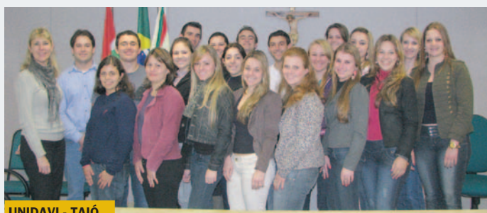
UNIDAVI - TAIÓ

Dois turmas visitaram o CRCSC nos meses de julho e agosto dentro do projeto Integração Acadêmica.