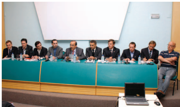
Audiência realizada no CR CSC em maio deste ano

CR CSC - A mudança é fruto de um trabalho desenvolvido por várias entidades empresariais e contábeis do país. Um exemplo dessa mobilização