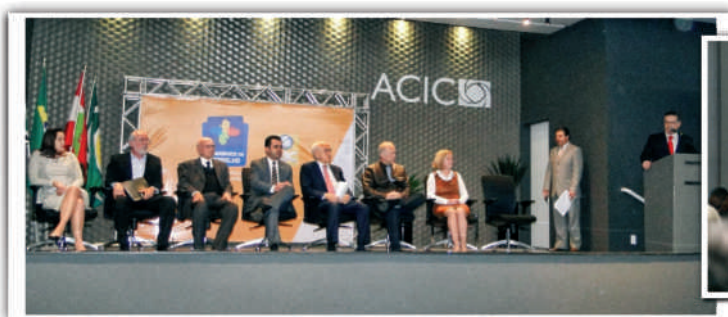
Ministro Manoel Dias falou a empresários e trabalhadores