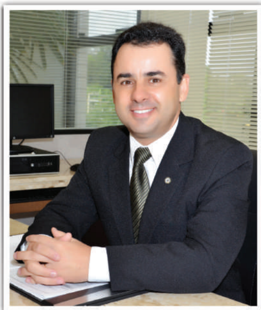
FALE COM O PRESIDENTE (48) 9914-0076 / presidencia@crcsc.org.br

Nos meses de setembro e outubro vivenciamos uma intensa discussão sobre a situação brasileira e isso demonstrou um amadurecimento em relação às análises da política, dos índices econômicos e sociais. Os profissionais da Contabilidade estão nesse caminho e cada vez mais envolvidos com atividades estratégicas.