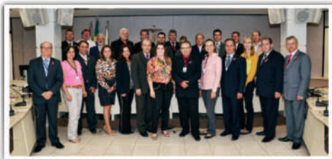
Na plenária de outubro muitos participantes aderiram ao rosa

realizadas em outubro, houve uma breve apresentação sobre o diagnóstico e tratamento do câncer de mama. Além disso, foram distribuídos para todas as delegacias e profissionais que participaram dos cursos promovidos pelo CRCSC os lacinhos cor de rosa para serem usados na lapela das camisas.