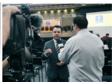
Presidente do CRCSC concedeu entrevistas sobre o eSocial

Empresários e trabalhadores estiveram no mesmo espaço para debater a evolução e os desafios do mercado. O Seminário do Trabalho: Relações e Políticas Sociais na Atualidade ocorreu em Criciúma, dia 18 de setembro, e em Joinville, no dia 29 de setembro. Com a presença do ministro do Trabalho e Emprego, Manoel Dias, as duas edições do evento foram realizadas pelo Grupo RIC, com apoio do Conselho Regional de Contabilidade (CRCSC), Senac/SC, Sindimetal, Associação Empresarial de Criciúma (ACIC), Associação Empresarial de Joinville (ACIJ), Siecesc Carvão Mineral e Prefeitura de Criciúma.