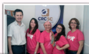
Delegacias fizeram sua parte e alertaram os profissionais de cada região sobre o tema